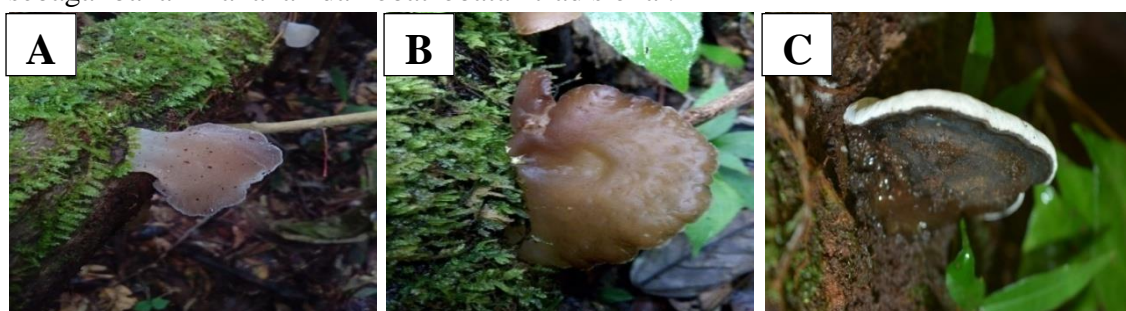
Gambar 2. Auricularia auricula (A); Auricularia sp. (B); Ganoderma sp.4 (C).

Berdasarkan wawancara yang telah dilakukan dengan beberapa masyarakat Kawasan Resort 7 Desa Sopotinjak Kabupaten Mandailing Natal masyarakat bisa dengan mudah mendapatkan jamur makroskopis di sekitar pekarangan rumah, di kebun dan di harangan tombak (hutan). Masyarakat mengkonsumsi jamur makroskopis sebagai bahan baku makanan dan bahan baku obat-obatan tradisional yang dipercaya membantu menyembuhkan beberapa jenis penyakit yang diderita masyarakat. Berdasarkan analisis data yang diambil dari literatur ditemukan tiga jenis jamur yang dapat dimanfaatkan sebagai bahan makanan dan obat-obatan tradisional.